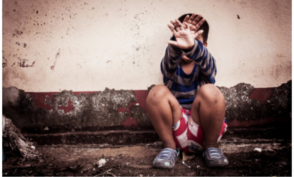
"כל הזמן מחשבות, פחדים חרדות. הבן שלי ממש הסתגר" (אילוסטרציה)

בשפה המשפטית, אבל יש כאן מעגלים שלמים שמושפעים מהאירוע - וזה אחד הדברים העיקריים עליהם עובד התהליך של צדק מאחרי".