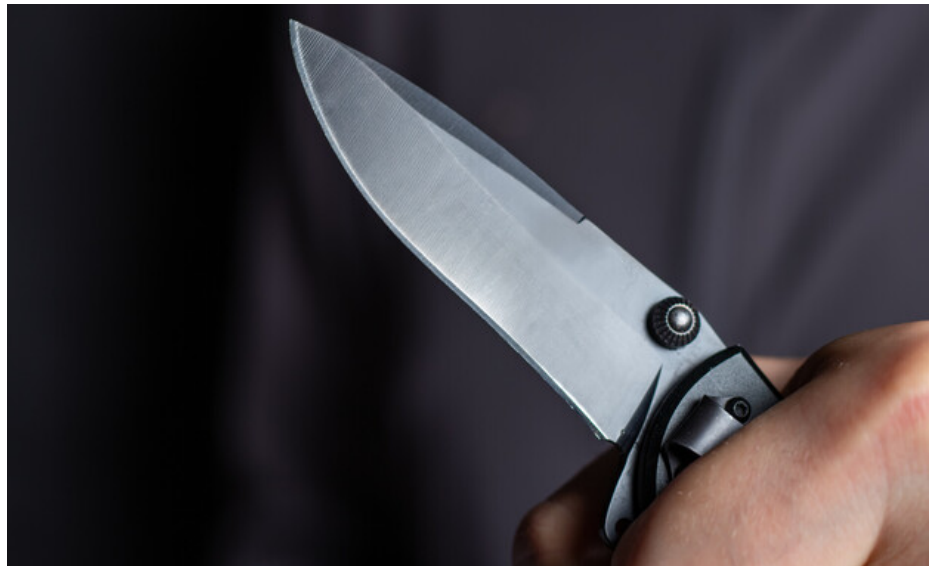
"ברגע ששמעתי את המילה סכין רצתי למטה בלי לראות בעיניים" (אילוסטרציה)

"מה שקרה זה שישבו חבורה של נערים באיזו 'זולה' בשכונה", אביגיל משחזרת, "והבן שלי הסקרן הציץ לראות מה הם עושים מבעד לחתיכת בד שהייתה שם. הם ישר צעקו עליו 'מה אתה עושה, תעוף מפה', הוא ענה להם והתחילו חילופי דברים ואז מכות. הבן שלי חטף קצת, התחיל ללכת לכיוון הבית תוך כדי שהוא אומר להם שהוא לא מפחד מהם. במדרגות ליד הבית הם תפסו אותו שוב, אז אחד מהם שאל אותו אם הוא 'רוצה לראות למה הוא מסוגל' והצמיד לו את הסכין לצוואר - אני חושבת שזה נגמר בנס, חצי שנייה לפה או תזוזה לא נכונה ואני לא רוצה לחשוב מה היה קורה לילד שלי".